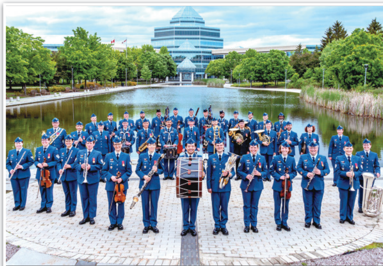
Central Band of the Canadian Armed Forces