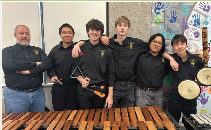
Earl of March Percussion Ensemble