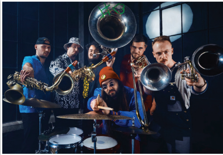
Big Smoke Brass